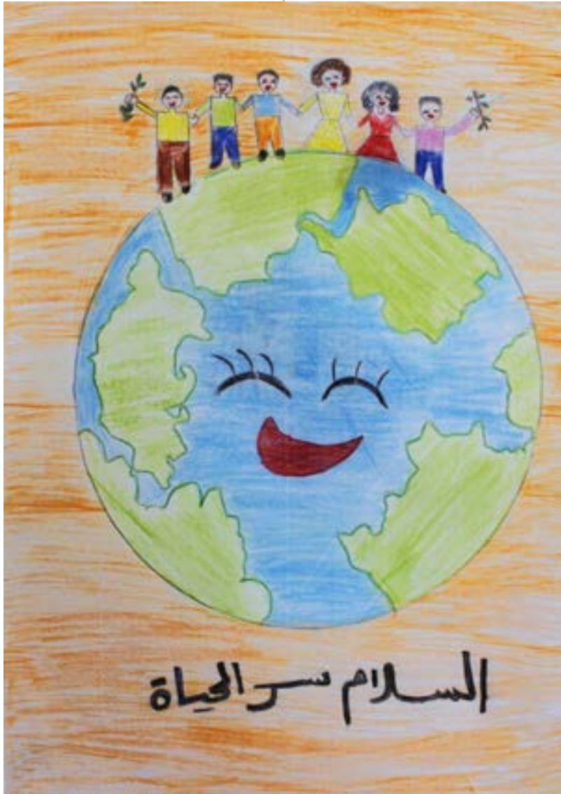
السلام سر الحياة