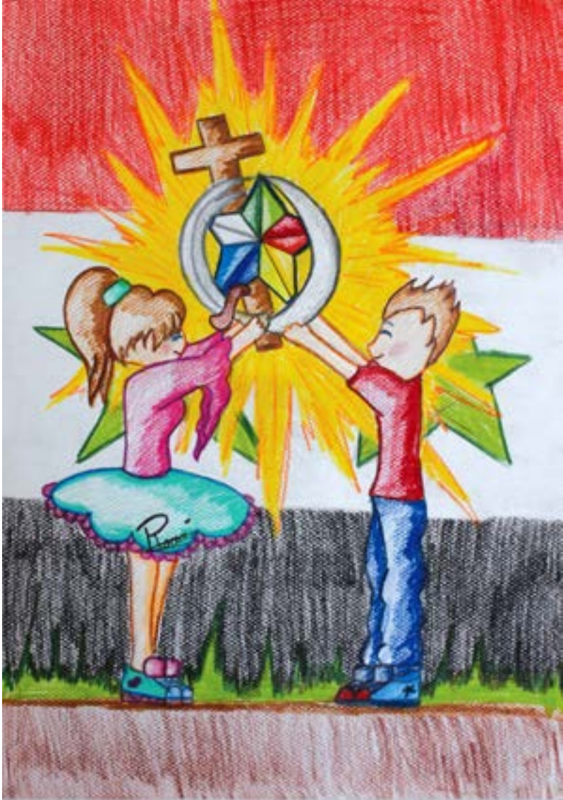
أطياف من قوس قزح.. كي تظل الشمس مشرقة في بلادي