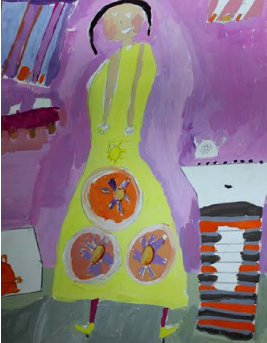
يا بيتنا الصغير يا جنة بسورية