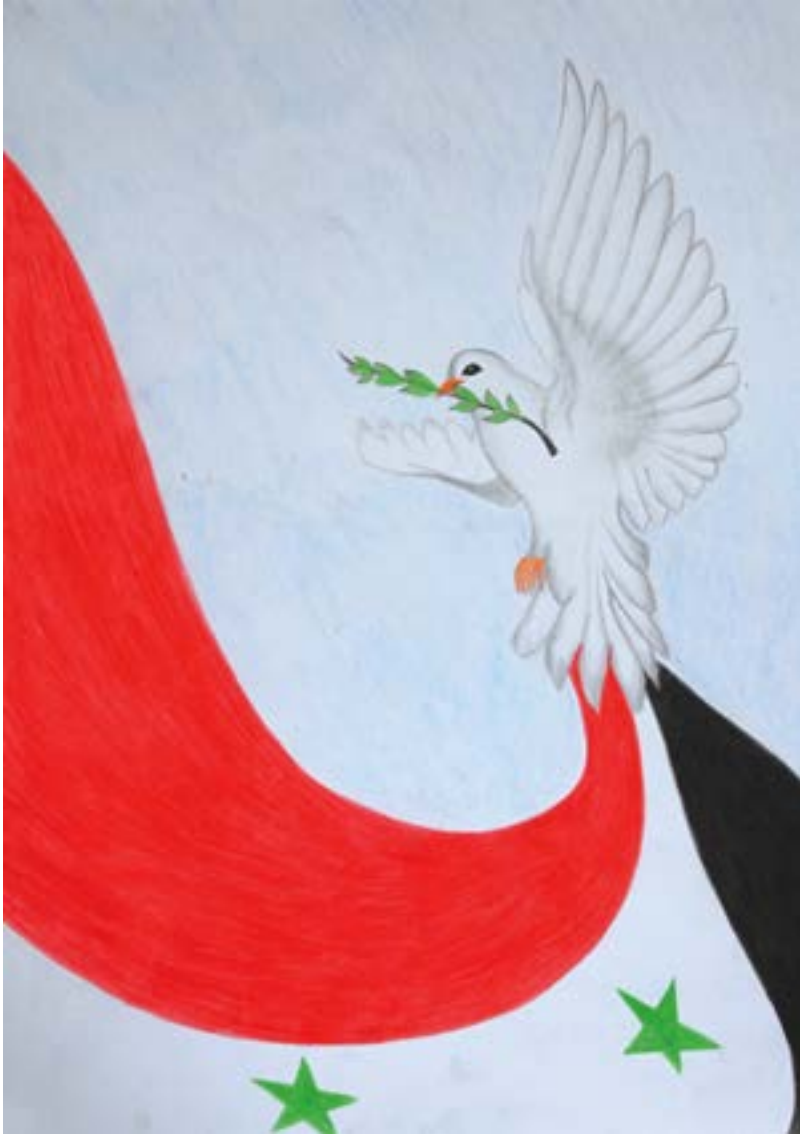
السلام طريق المحبة