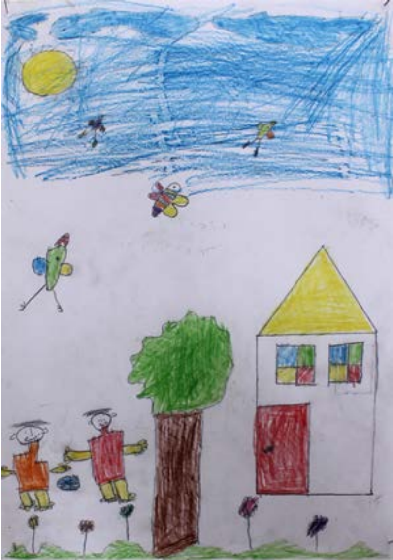
أحب أن ألعب تحت الشجرة