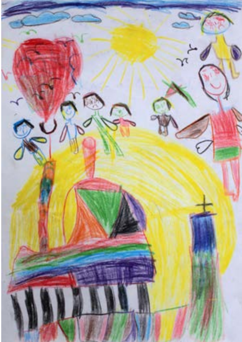
الشمس أجمل في بلادي وخصوصا عندما تمانق الفرات