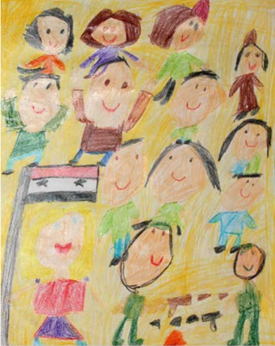
((وعلى الارض السلام وفي الناس المسرة))