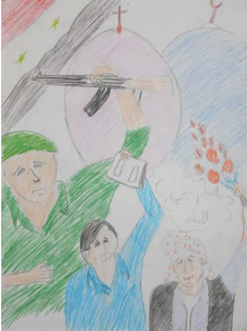
بaleلم نبني الوطن