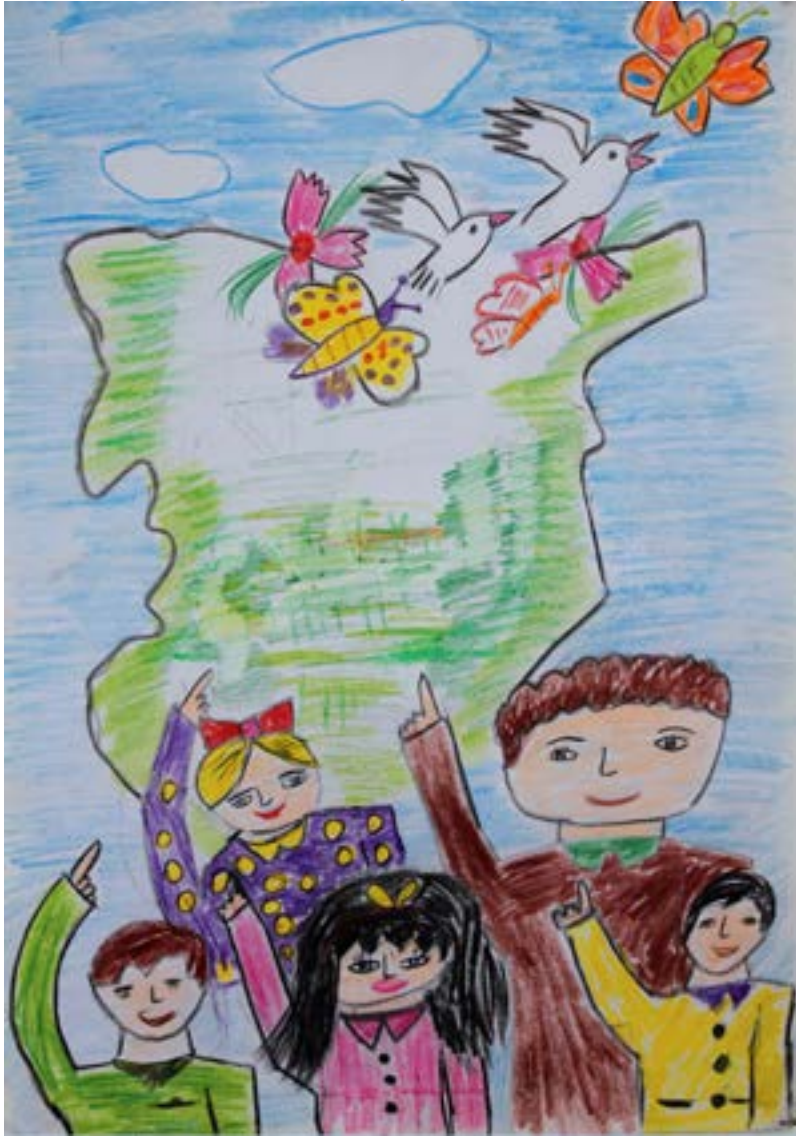
وطني الغالي يحضنه السلام هو بلسم وشمسه دفاء وأمان