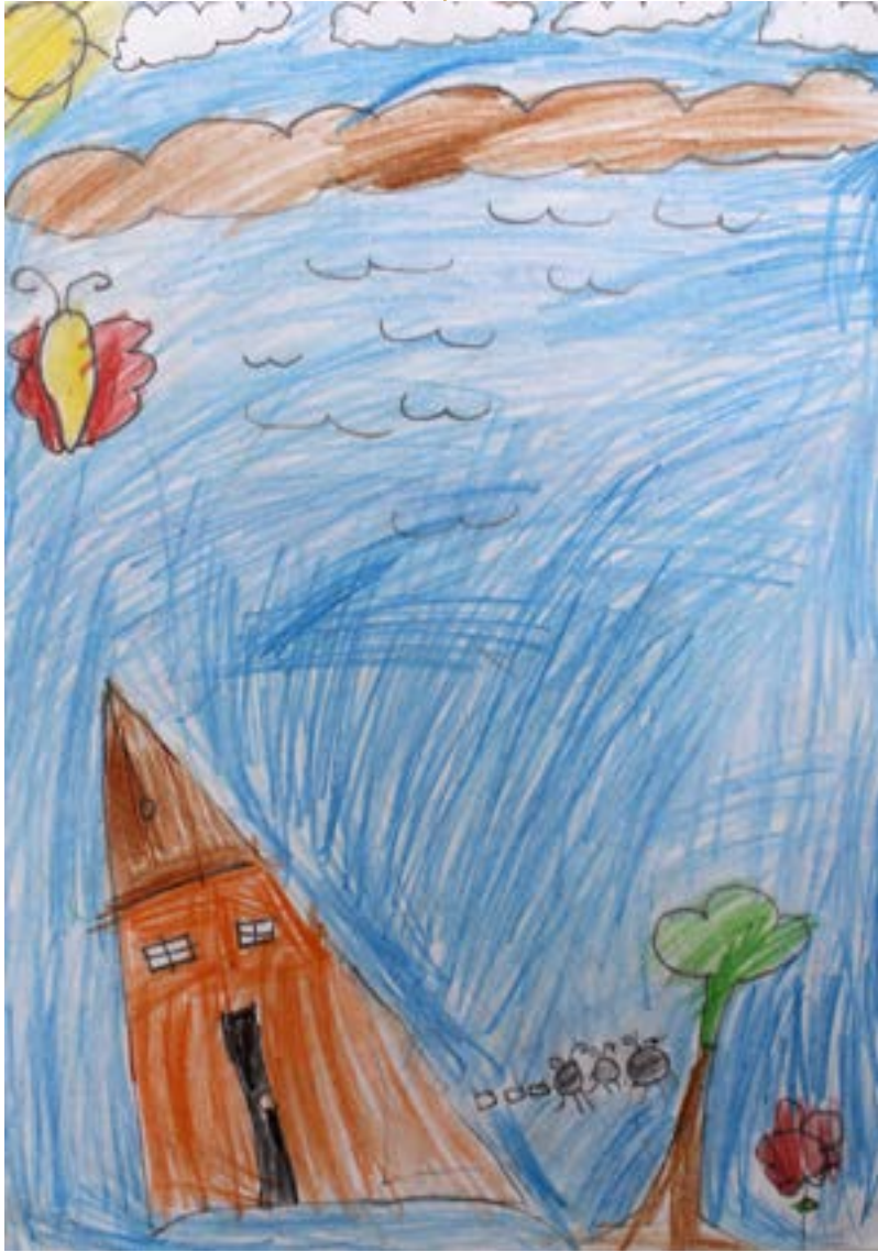
عندي بيت وارض صغيرة فأنا الان يسكنني الأمان