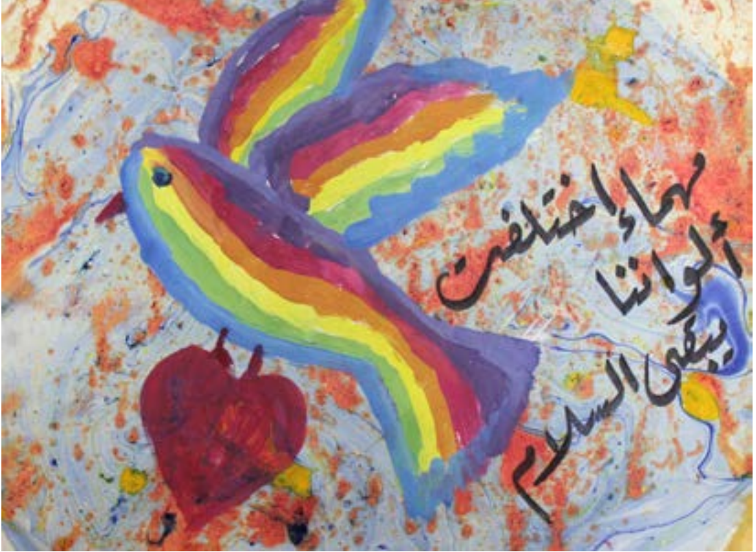
مها اختلفت ألواننا.. يبقى الحب والسلام