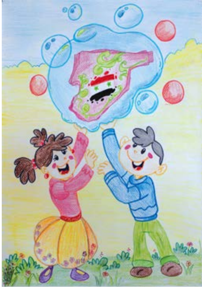
لان سورتنا فوق كل الاعتبارات نرفعها فوق الرؤوس