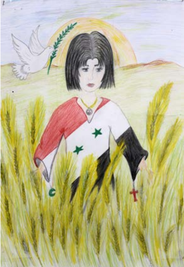
لعل السلام قريب على سورية