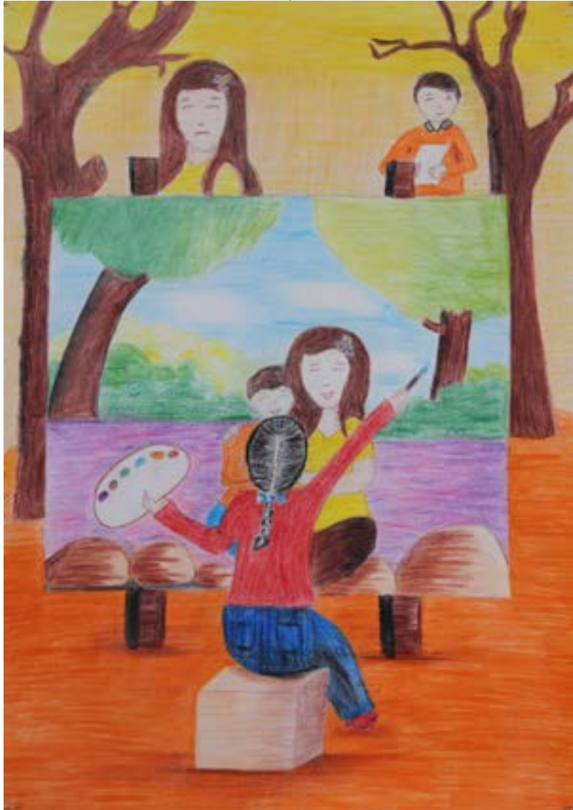
سامح فانت أخطأت في يوم ما...