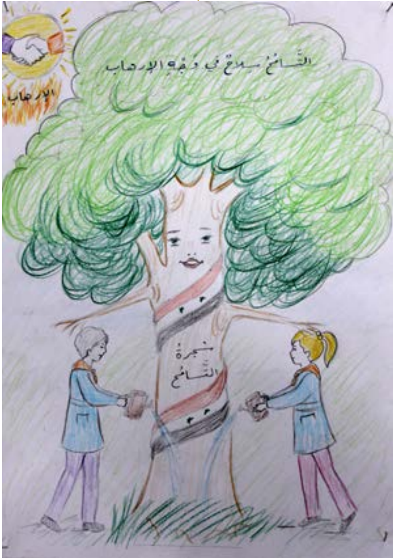
التسامح سلاح في وجه الإرهاب