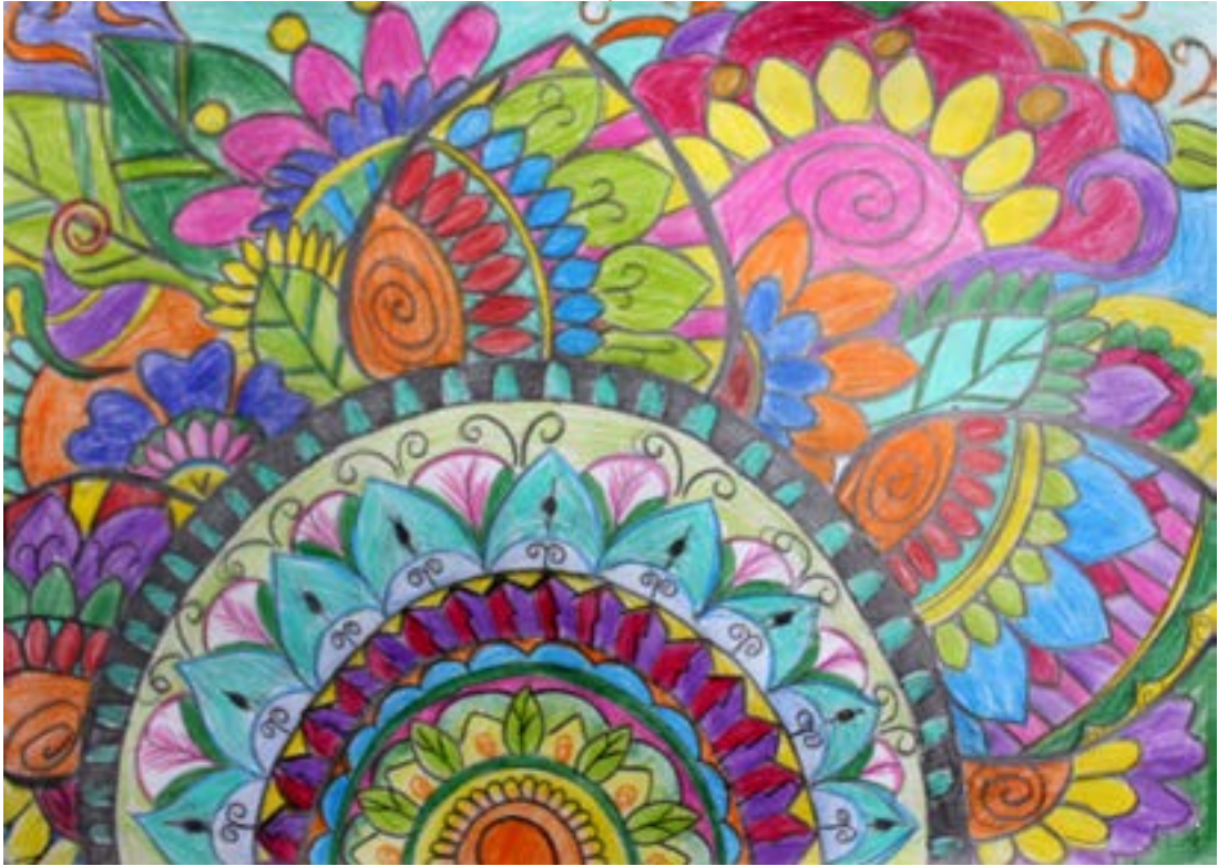
سورية موزايك جميل من كل الألوان... وتجانس رباني دعونا لانفقده