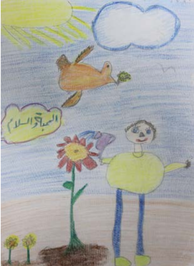
الصدقة والمحبة كنز الحياة