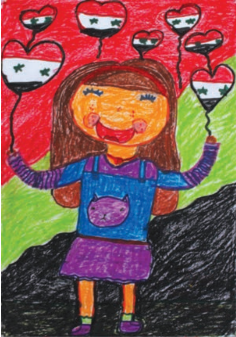
أحبك من عميق قلبي يا وطني