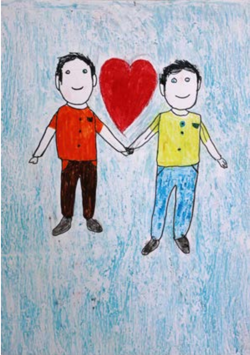
بالحب يسمو التسامح