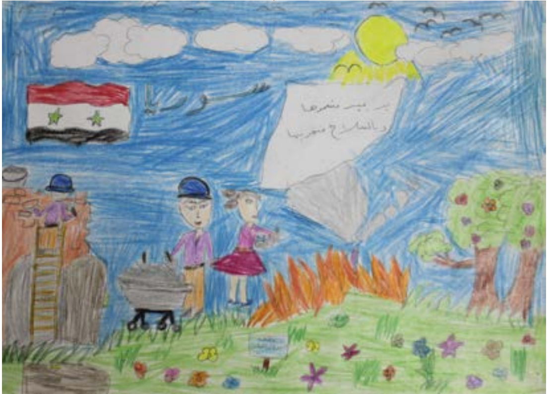
يد بيد نعلمها.. وبالسلاح نخربها