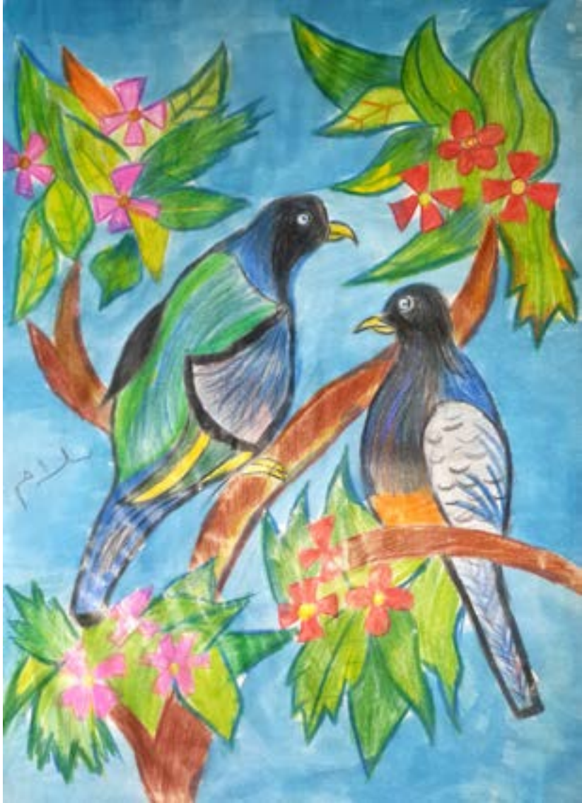
التسامح سر الفرح والسعادة