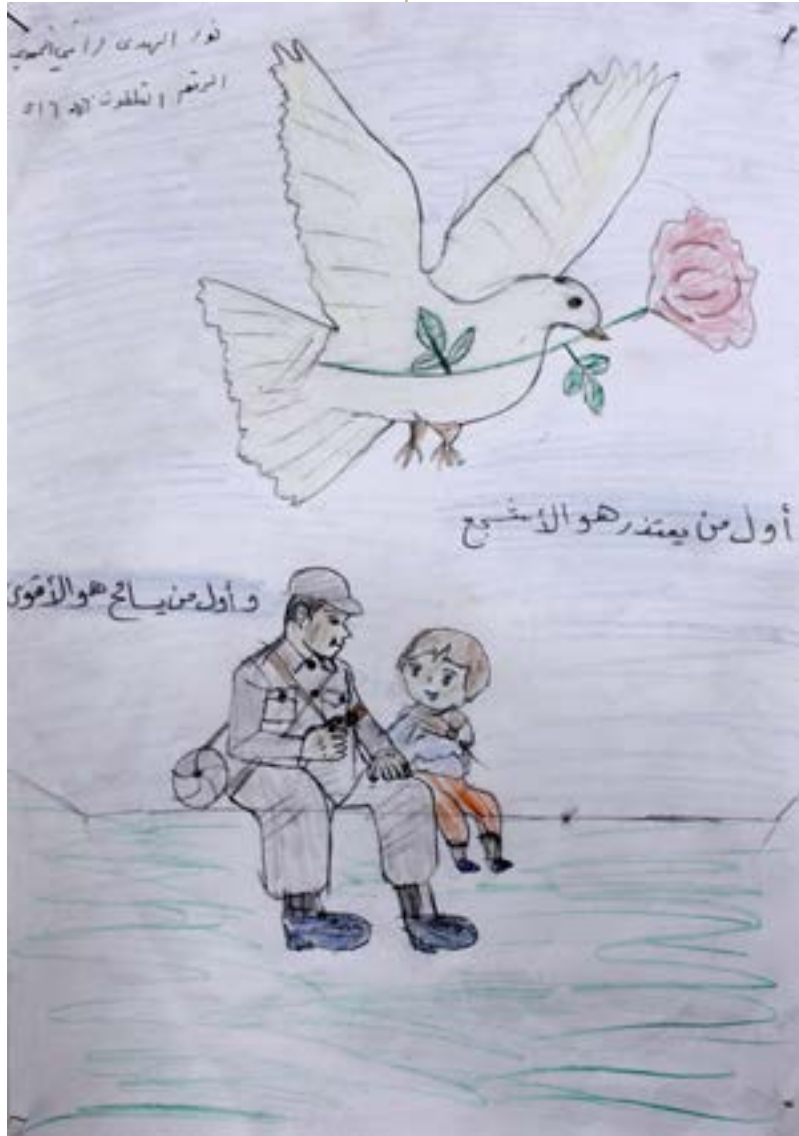
أول من يعتذر هو الأشجع .. وأول من يسامح هو الأقوى