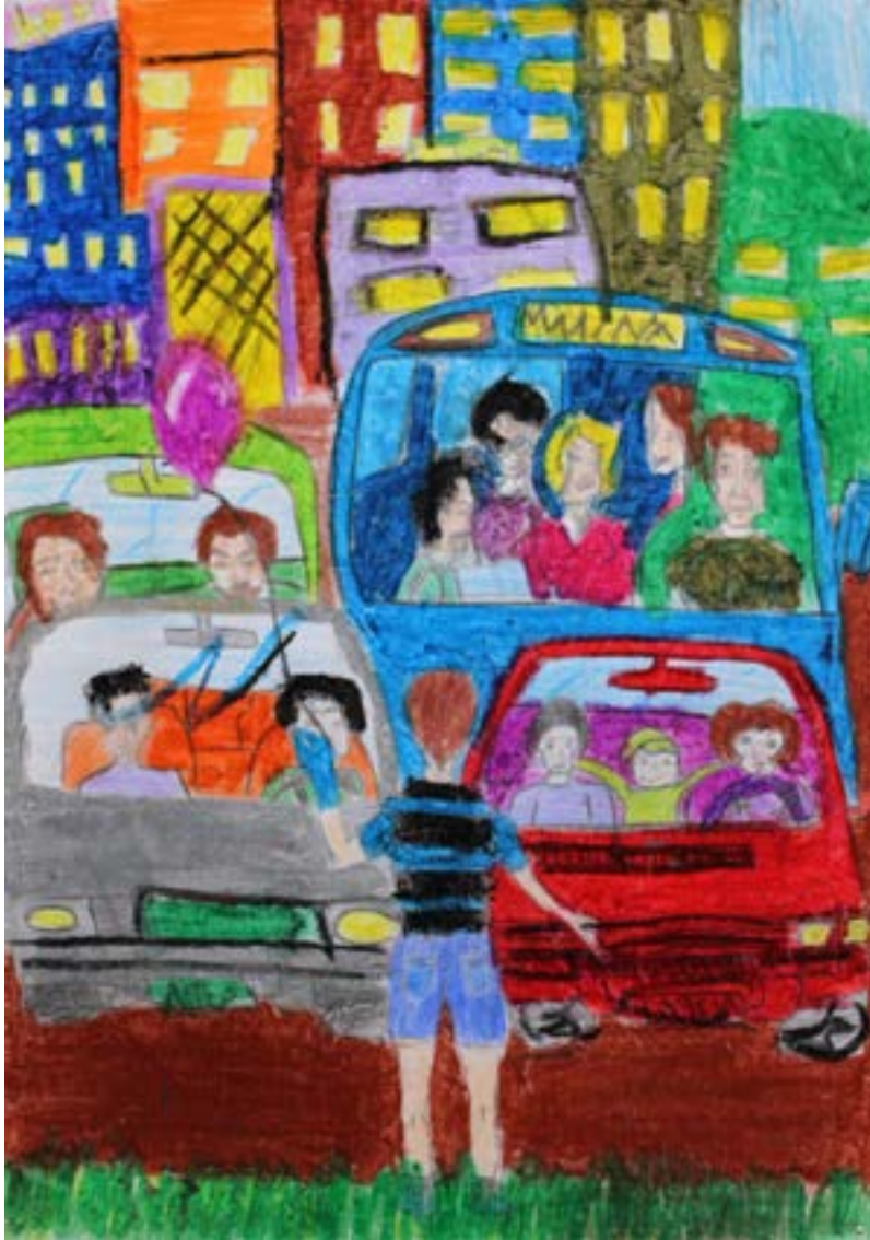
محبة الوطن من الإيمان